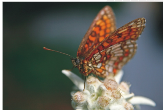
Gizdalin - Blaž Dolinar