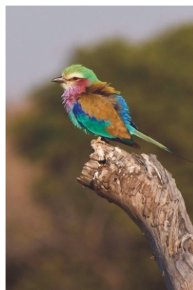
Življenje v Barvah - Andraž Golob