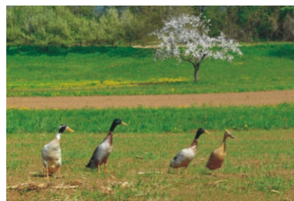
Štirje v vrsto - Davor Medič